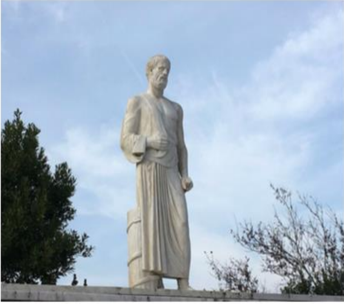
Fig.1 A statue of Hippocrates in Larissa, in central Greek area of Thessaly