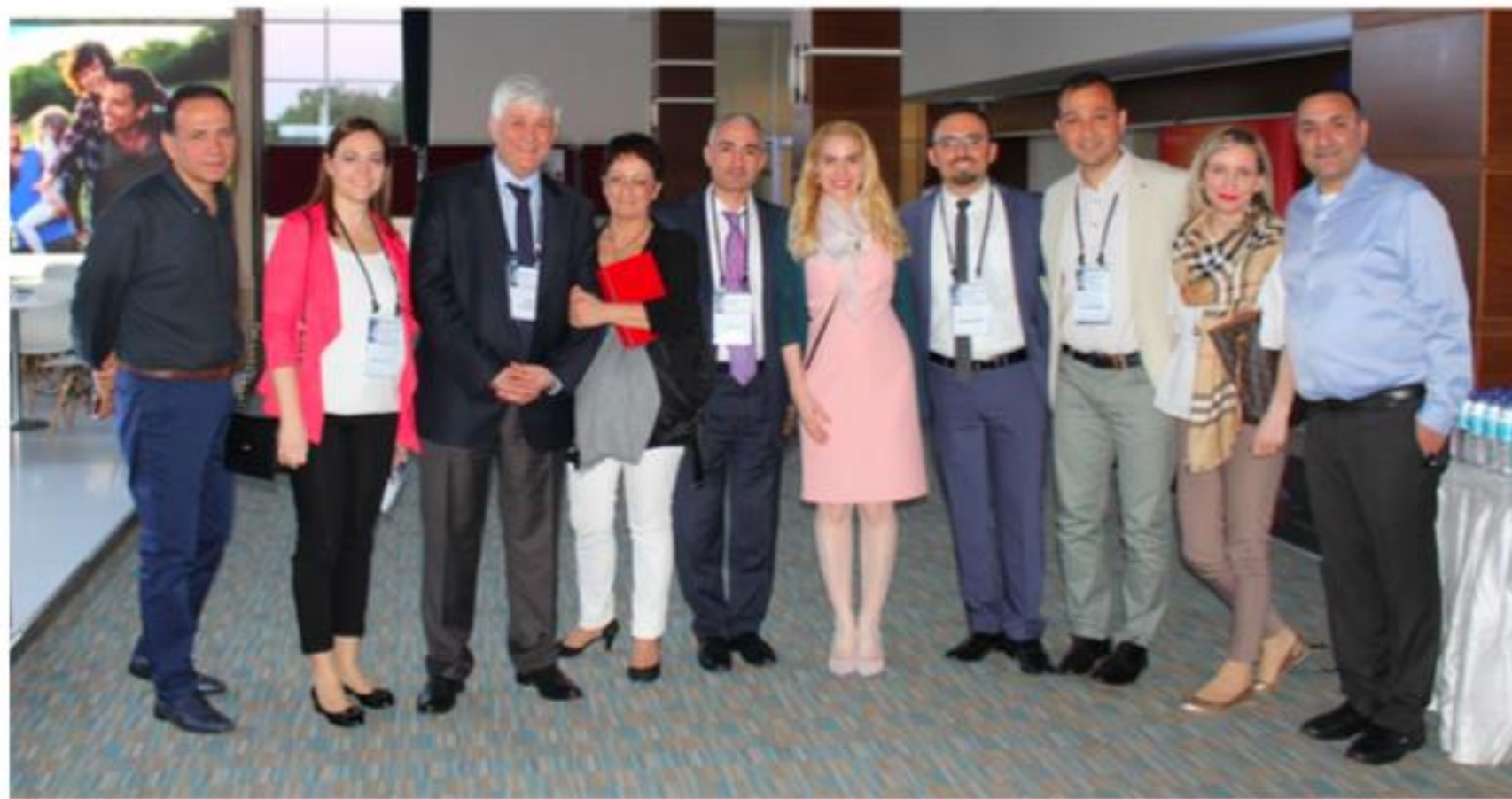
Fig. 3 The IV national congress in pediatric rheumatology, April 2018, Bodrum, Turkey